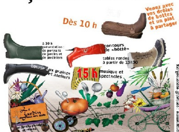
Jardin de 7 lieux : 2 bis rue de Bazaine, Parc Eco du saut Le Cerf 06 42 62 47 62

Samedi 8 Octobre 2011 au Jardin de 7 lieux à Epinal ça vous Botte ... ?